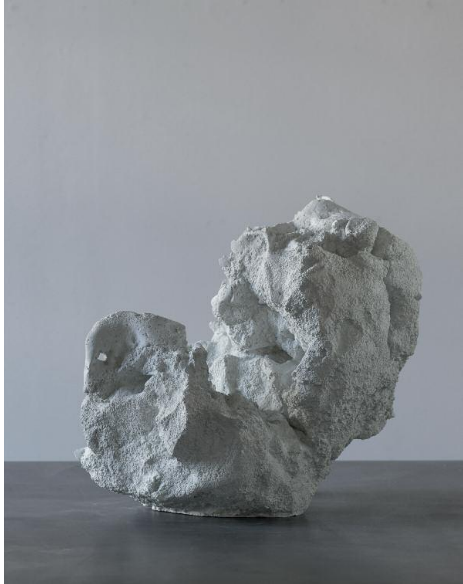
Restschnee I 2018 Betonguss L 44 x B 42 x H 41 cm