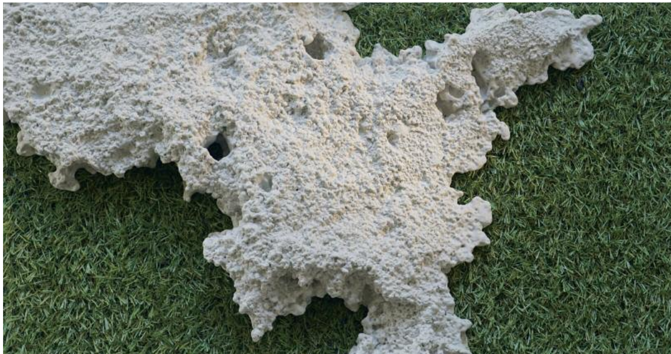
Ausapern 2018 Betonguss und Kunstrasen auf Sperrholz L 44 x B 24.5 x H ca. 3 cm