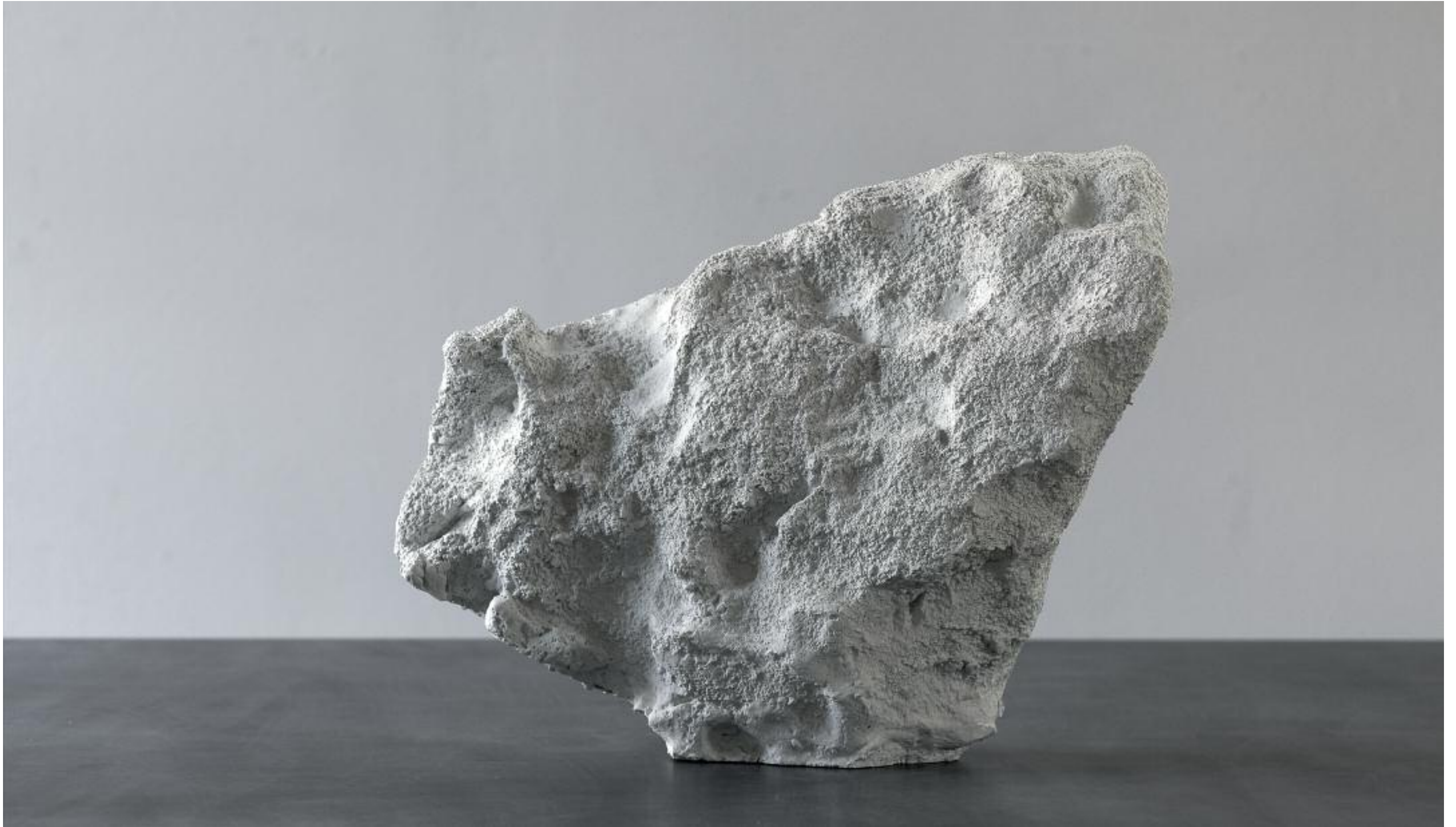
Restschne III 2018 Betonguss L 53 x B 36 x H 44 cm