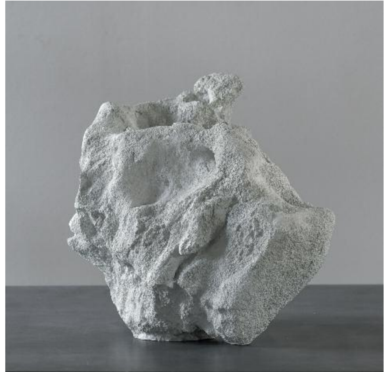
Restschne II 2018 Betonguss L 55 x B 27 x H 41 cm