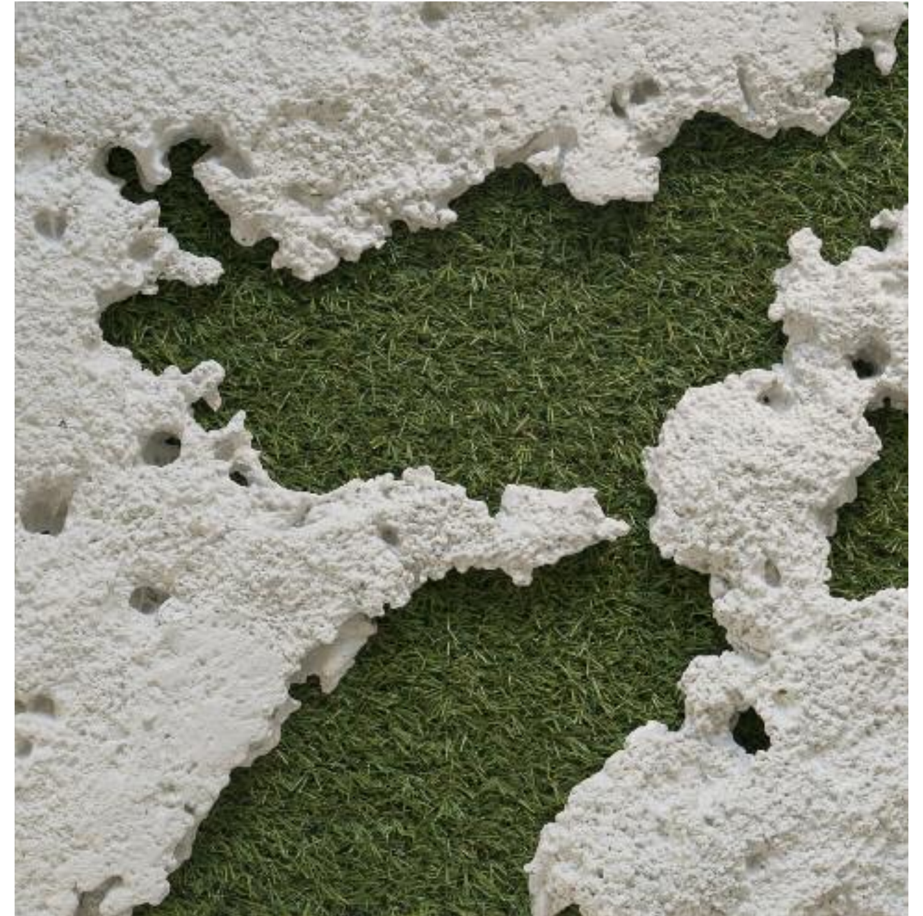
Ausapern 2018 Betonguss und Kunstrasen auf Sperrholz L 36.3 x B 36.3 x H ca. 3 cm