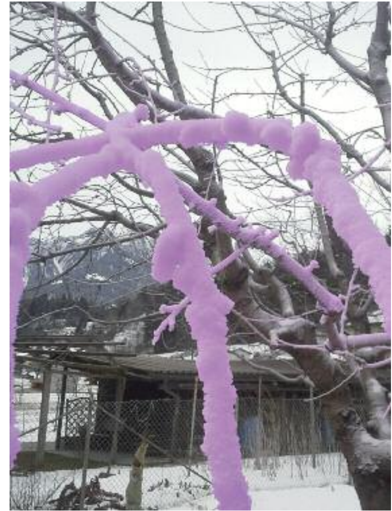
Schnee 2015 eingefärbter Kunstschnee Beschneigungsanlage für unterschiedliche Projekte, ab -4C° einsetzbar