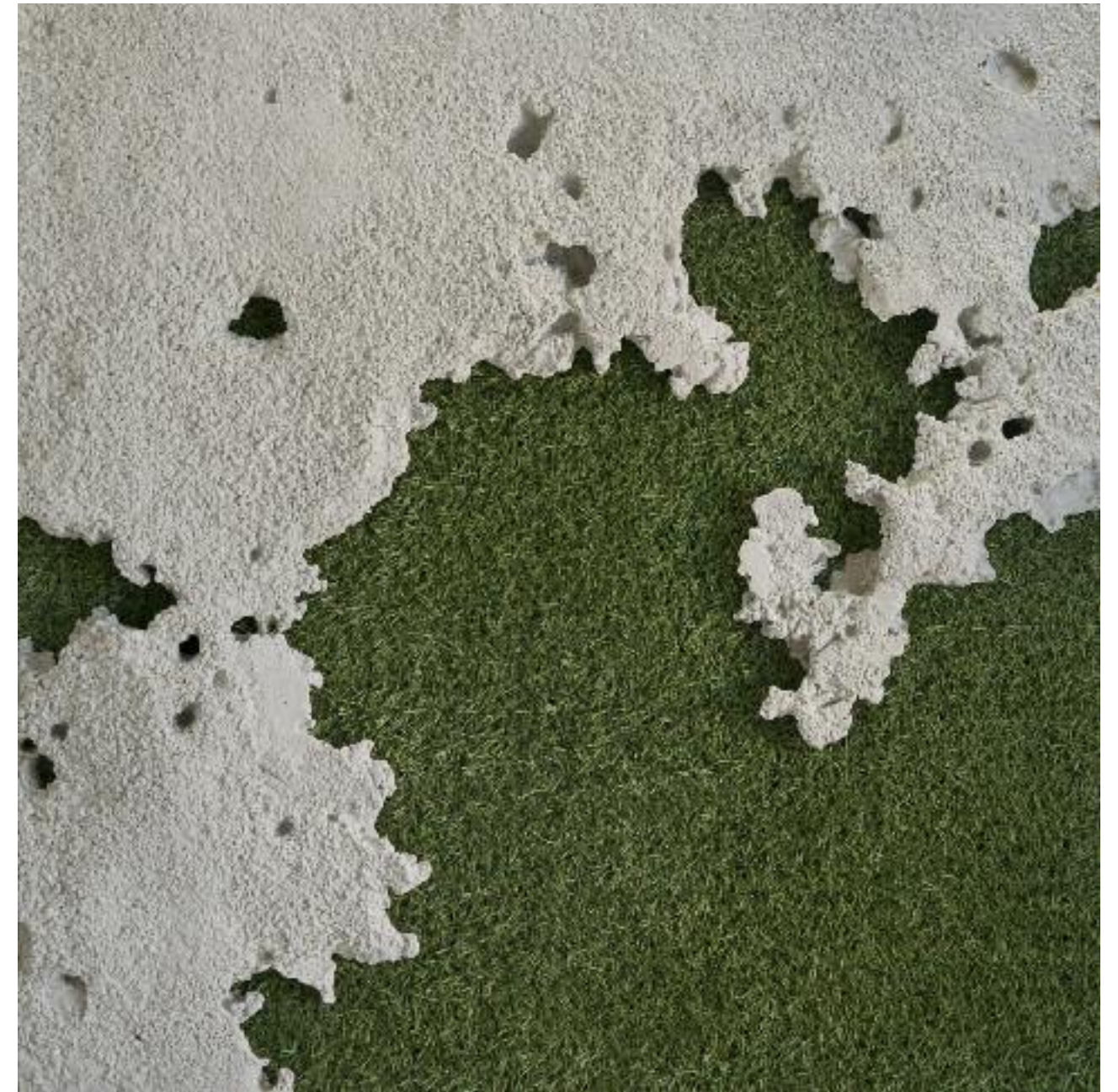
Ausapern 2018 Betonguss und Kunstrasen auf Sperrholz L 66,6 x B 66,6 x H ca. 3 cm